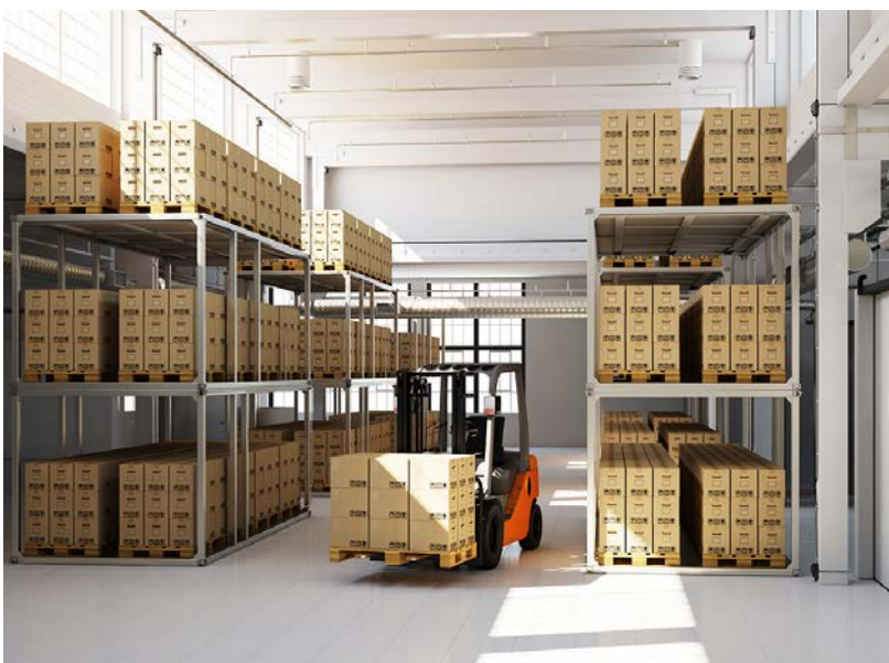
Lager/Archivierung: Das Unternehmen verfügt über umfangreiche Lagerkapazitäten. Hier lagern z. B. die wichtigen Kundendokumente in Archivboxen.