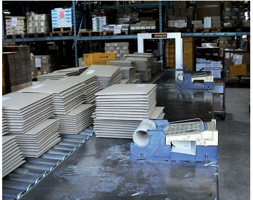
Massenaussendungen: Ergänzungslieferungen für Fachliteratur werden auf den Weg gebracht.