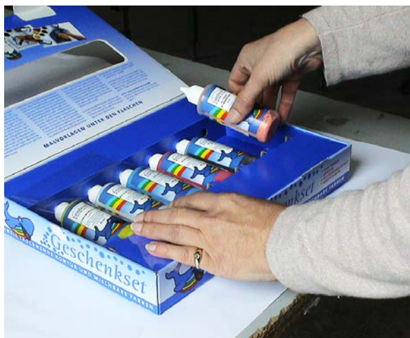
Bestückung: Eine Geschenkpackung wird mit verschiedenen Komponenten befüllt.

Bei der Konfektionierung werden z. B. Geschenkverpackungen spezifiziert und Thekendisplays bestückt. Zum Angebot gehört auch der Aufbau von Bodendis-