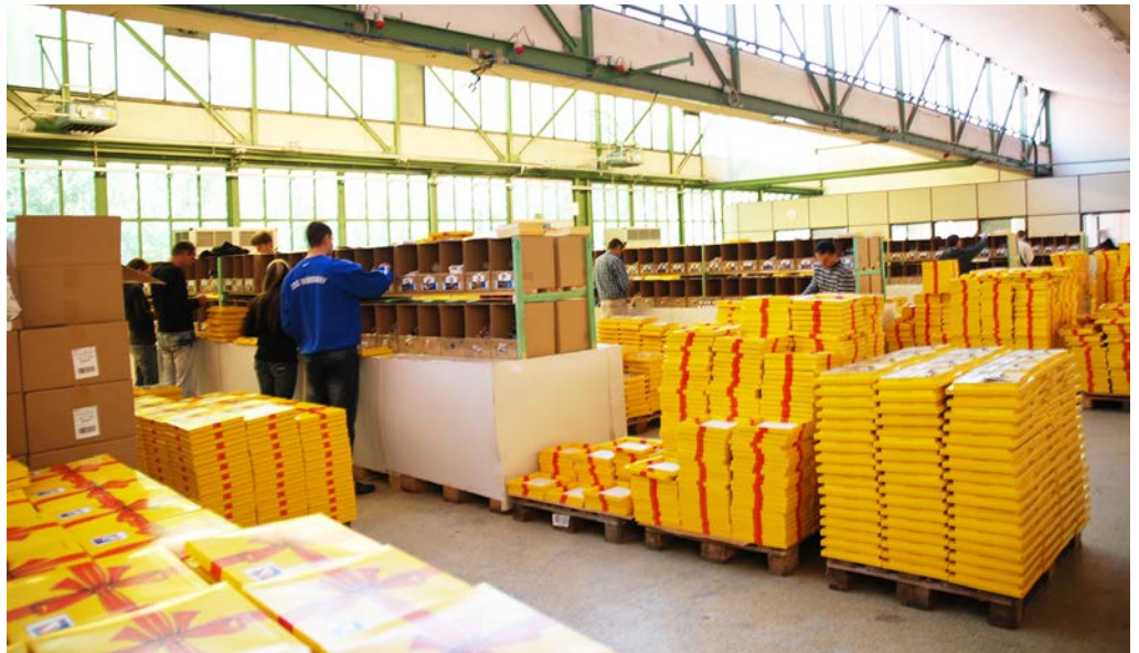
Konfektionierung: Für die Deutsche Post AG werden werthaltige Sets zusammengestellt.

Gewachsen an den Aufträgen der Vergangenheit und mit Mitarbeitern der ersten Stunde an der Seite, gehören die Zusammenhänge und Funktionsweisen als Dienstleistungsunternehmen im Versandservice zum Know-how. So werden beispielsweise beim Versand von Werbemitteln Adressdaten aus Excel, Access oder anderen Datenbanken übernom-